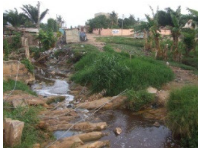
Den ikke eksisterende broforbindelse (foto svel)

Vi kan lige så godt erkende først som sidst at forløbet med at etablere et partnerskab med Green Alliance International Ghana (GAIGH) ikke er lykkedes. Vi have fået en bevilling på 8.000,00 kr. fra BUPL's solidaritets fond med henblik på at gennemføre nogle workshops eller andre aktiviteter, der kunne medvirke til at sætte lidt fut eller fart i GAIGH for om muligt at oparbejde dels nogle erfaringer i at samarbejde, dels at gennemføre aktiviteter og endelig i mindre grad at styrke deres organisation og struktur. GAIGH har som udgangspunkt at sætte fokus på at koble uddannelse, beskyttelse af miljø og kultur sammen til en helhed bl.a. ved praktiske uddannelser for unge. Der er i den forbindelse ingen som helst tvivl om, at en sådan kobling er meget tiltrængt i Ghana, og der er mange steder, hvor en NGO som GAIGH kunne være med til at gøre en forskel.