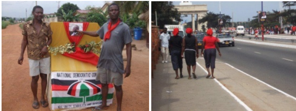
Gade livet afspejlede landssorgen

24. juli blev Ghana klædt i rødt og sort som tegn på sorg over at præsident John Atta Mills, helt uventet døde. Med et slag var var Ghana ramt af sorg og usikkerhed om, hvad det kunne betyde, og der sænkede sig en mærkbar tavshed over landet. Det viste sig dog hurtigt at Ghana var i besiddelse af et så politisk modent system, at vice præsidenten John Mahama i løbet af mindre end 5 timer blev taget i ed som ny præsident.