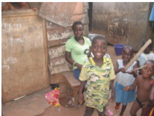
Det kan blive nogle af de børn ShAA vil arbejde med

Først en helt særlig velkomst hilsen til børn og unge samt medarbejdere i Fritids- og Ungdomsklubben "Basen" i Tåstrup og især til Mentor gruppen. I er den første institution der har tegnet medlemskab af ShAA og derved medvirke til at være med til at gøre en forskel for nogle børn og unge i 3.verden – helt konkret i Ghana. Vi håber I får glæde af jeres medlemskab, og vi samtidig vil være i stand til at leve op til jeres forventninger om det vi kan bidrage med, nemlig information og viden om børn og unges forhold i et 3.verdens land. En forpligtelse vi er meget glade for at have og arbejde med.