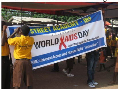
Street Academy har tradition for at være på gaden 1. dec – International AIDS dag

Det anslåede antal af aids dødsfald synes også at have toppet og er siden 2004 faldet fra 2.1 millioner til 1.8 millioner i 2009. Hvilket primært skyldtes øget adgang til antiretrovirale lægemidler i fattige lande, herunder Ghana. Men til trods for denne udvikling fortsætter antallet af mennesker, der lever med HIV på verdensplan med at vokse især fordi mennesker smittet med virus overlever længere end tidligere.