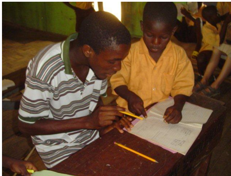
Omsætning fra ord (MDG) til konkret handling i Street Academy

MDG 2: sikre at alle børn uanset køn er i stand til at gennemføre grundskolen. Det betyder at der skal være tilstrækkelig kapacitet til at kunne give alle børn i den skolepligtige alder adgang til grundskolen, at alle der starter i første klasse også er i stand til at gennemføre hele skoleforløbet, samt at mindste niveauet af 15-24 årige der ikke er i stand til at læse og skrive.