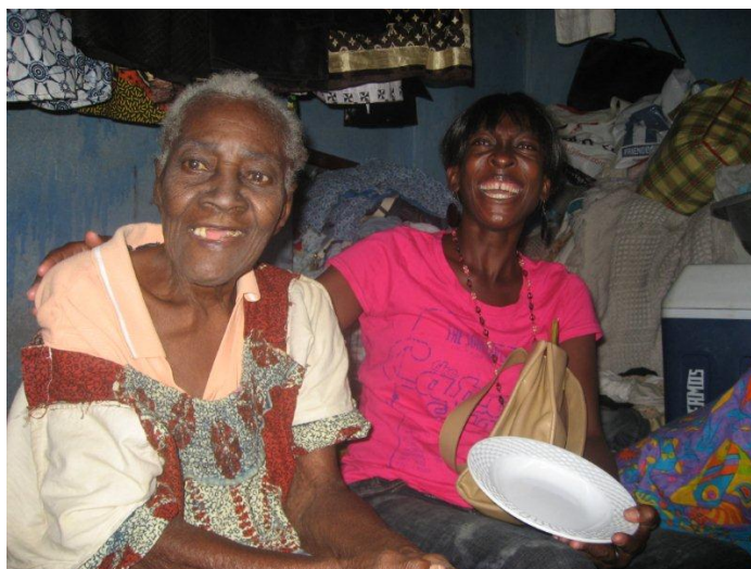
Klar til Kinkey og Sardiner

Næste besøg var hos Paulina og hendes børnebørn – hun får støtte til hendes barnebarn Bruce på 13 år. Sidste besøg gjaldt Leticia der er i slutningen af 70'erne, hun bor sammen med George i Koloko – lokal bydel i James Town – et af de virkelig fattige områder i Accra, og Leticia's sted var nok det fattigste jeg så og det mest usunde, jeg blev konfronteret med. Begge steder var der så mange børn til stede, store, mellem store og små børn, der var rigtig meget interesseret i, hvem jeg nu var, men også tillidsfulde med det samme. Det var en helt fantastisk oplevelse at opleve børnene sammen med deres bedstemødre, men også at være sammen med dem, snakke med dem, udveksle blikke, smile og grine. Et at stederne havde den meget tynde kattemor lige fået killinger og jeg måtte fotografere alle, både børn, kattekillinger, bedstemødre – ja de var helt vilde med at blive fotograferet.